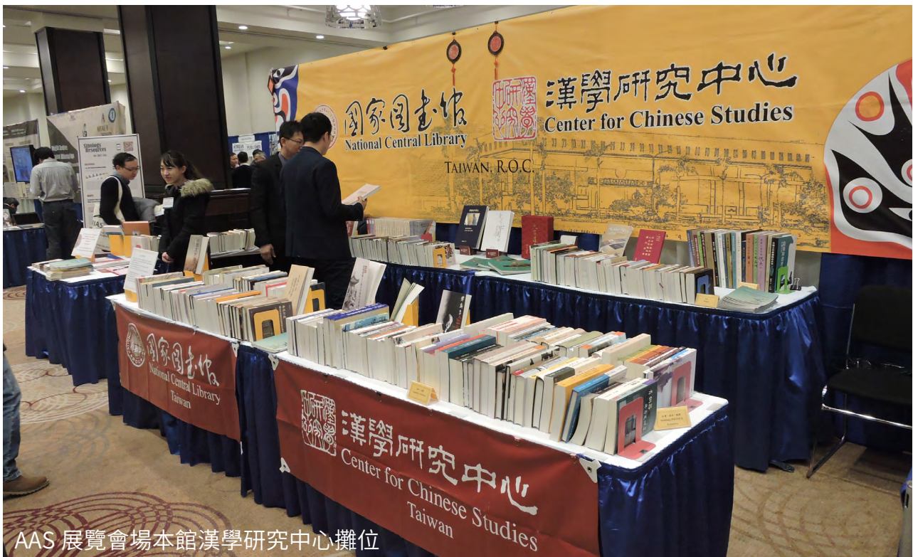
AAS 展覽會場本館漢學研究中心攤位

出席者含括美國各大學亞洲領域研究人員、圖書館人員及來自世界各地的亞洲學術研究者，以及出版發行機構等。對於歐美地區之亞洲研究學者而言，如與 EACS 雙年會相較，EACS 雖然也有差不多有 40 餘國 800 位學者參加，但學者投稿發表論文總數則不及 AAS 規劃超過 360 場各類型專題會議之半。因此，從學術曝光度、人際關係的建立、爭取職位面試，以及研究資訊的交流，參與 AAS 年會對於北美地區從事亞洲研究的年輕學者至為重要。