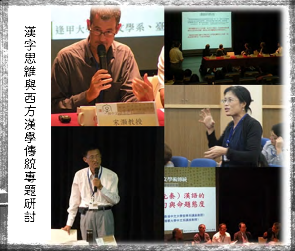
漢字思維與西方漢學傳統專題研討