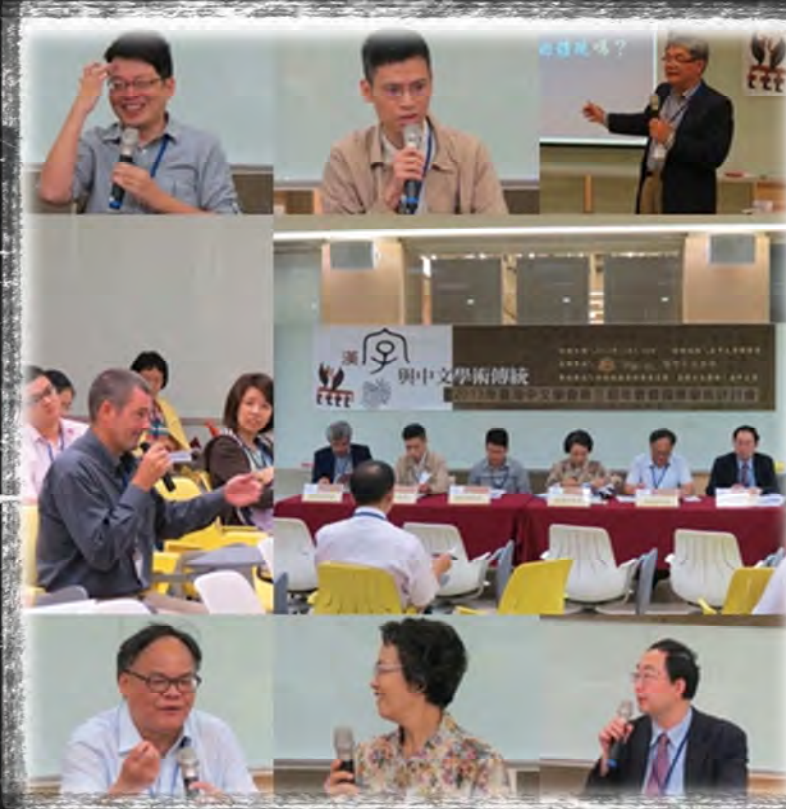
漢字思維與中國思想專題研討